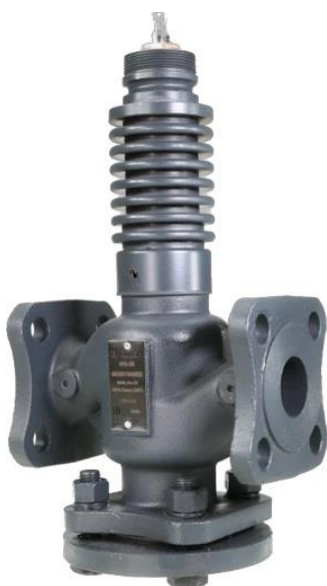
Рис. 1 - Внешний вид клапана регулирующего VFS-2R

VFS-2R – клапан регулирующий, седельный, фланцевый, с разгрузкой по давлению (для DN65-200), предназначен для применения без адаптера с электроприводами: