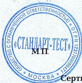
Схема сертификации: 1с.