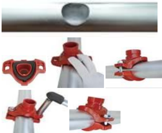
Рис.3. Установка отвода (седелка) под муфту на трубопровод.