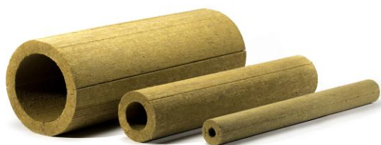
Цилиндры ХОТPIPE SP

В зависимости от поставленных задач и среды применения завод ХОТПАЙП может предложить цилиндры с несколькими вариантами покрытия.