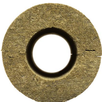
Цилиндр плотностью 100 кг/м 3

Подходят для систем отопления с перегретой водой. Для теплоизоляции байпасов. Для изоляции круглых воздуховодов.