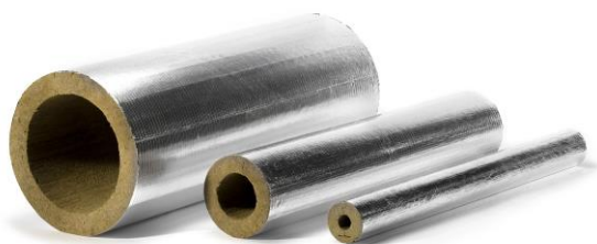
Цилиндры ХОТPIPE SP Alu

Минераловатные цилиндры без покрытия для применения в помещениях. Можно применять на улице после установки дополнительного защитного покрытия из оцинкованной стали.