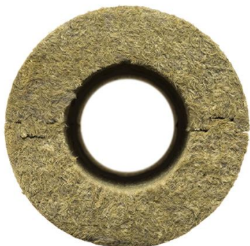
Цилиндр плотностью 80 кг/м 3

В зависимости от задач и температуры теплоносителя завод ХОТПАЙП может предложить цилиндры нескольких плотностей.