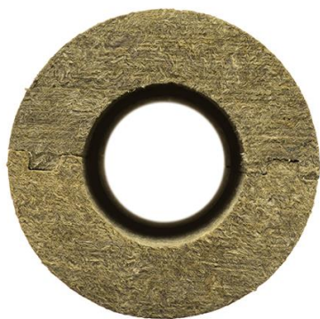
Цилиндр плотностью 120 кг/м 3

Плотные на ощупь, а не на словах. Не ломаются даже при малой толщине изоляции.