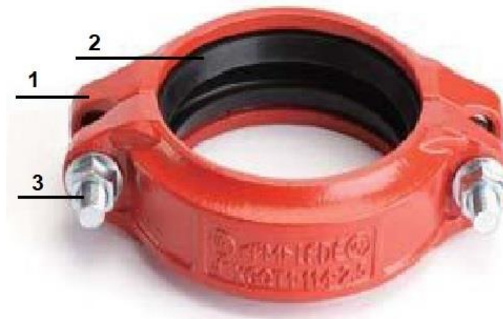
Рис.2. Жесткая муфта «LEDE».