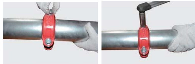
Рис.3. Грувлочное соединение жесткой муфтой.