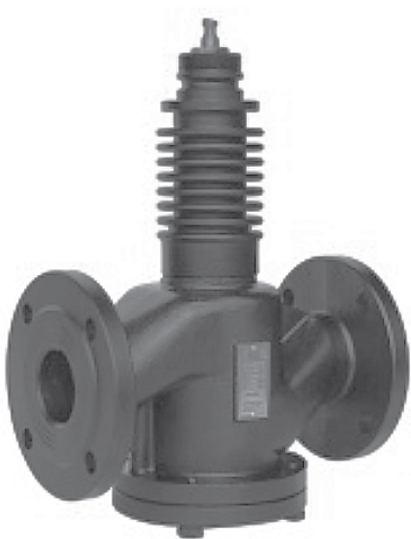
Рис. 1 - Внешний вид клапана регулирующего VFS-2R

VFS-2R – клапан регулирующий, седельный, фланцевый, с разгрузкой по давлению (для DN65-200), предназначен для применения без адаптера с электроприводами: